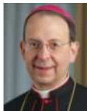
ARZOBISPO WILLIAM E. LORI

"El hacha ya está puesta a la raíz de los árboles, y todo árbol que no da buen fruto será cortado y arrojado al fuego". (Evangelio para el 7 de diciembre, Mateo 3,10)