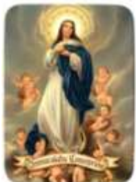
08-Nª Sª Inmaculada