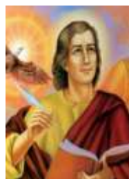
27-S. Juan Apóstol