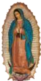
12-Nª Sª Guadalupe